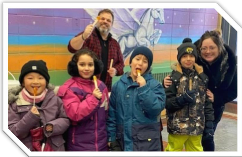
On déguste de la tire d'érable à l'école Jean-Leman!