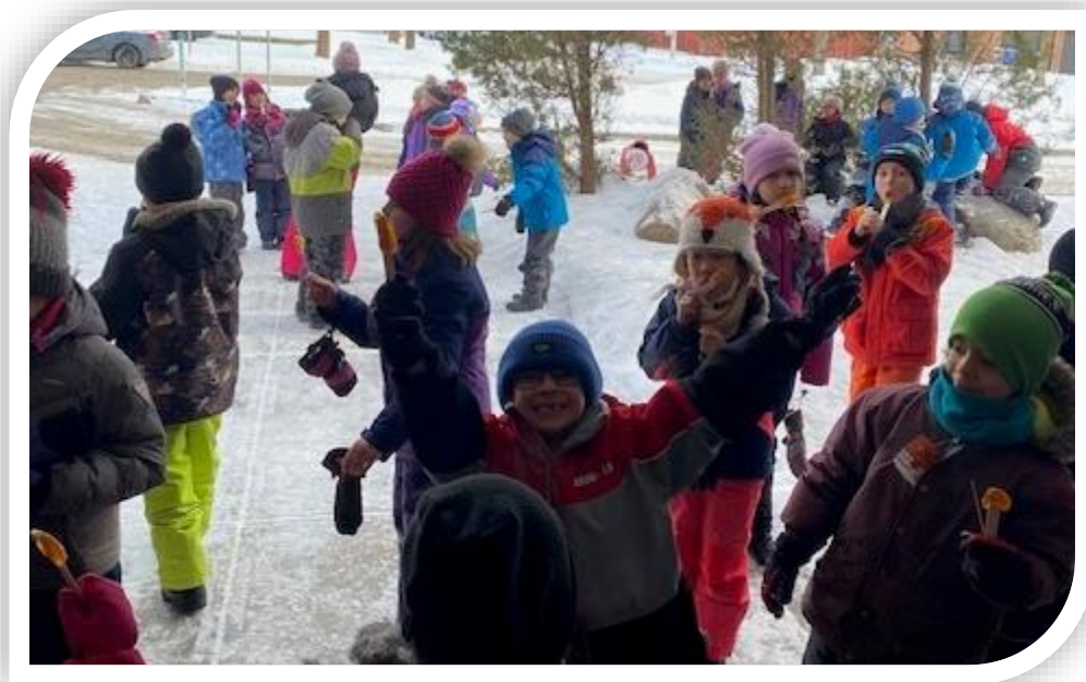
Une magnifique journée sous le thème « la cabane à sucre à l'école »!