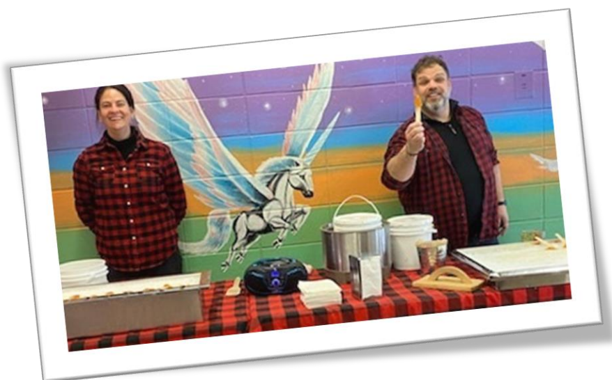
Merci à l'équipe de La Petite Cabane à sucre de Québec!