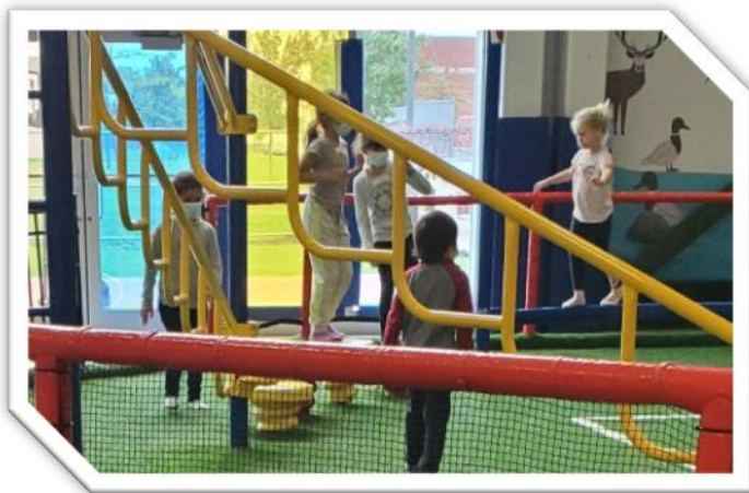
Les élèves du SDG lors de la sortie à Zükari le 22 octobre dernier.