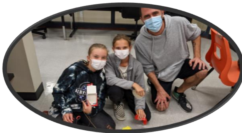
Projet Micro :Bit en éducation physique