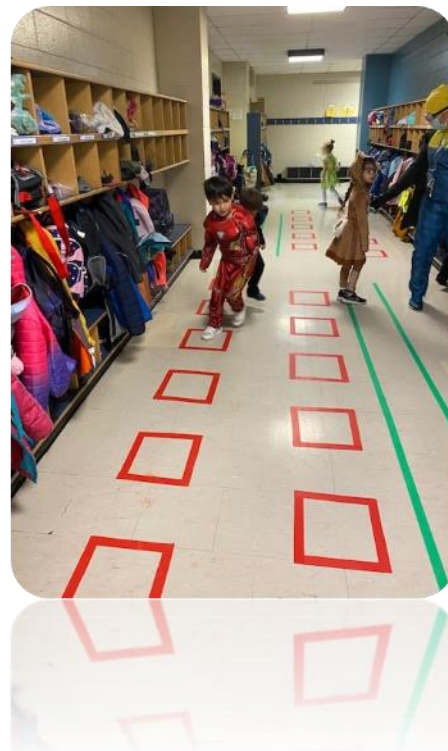
Corridors actifs au préscolaire