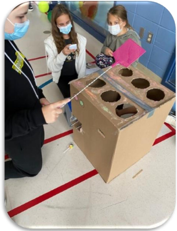
Projet « Fun Fair » du groupe 655